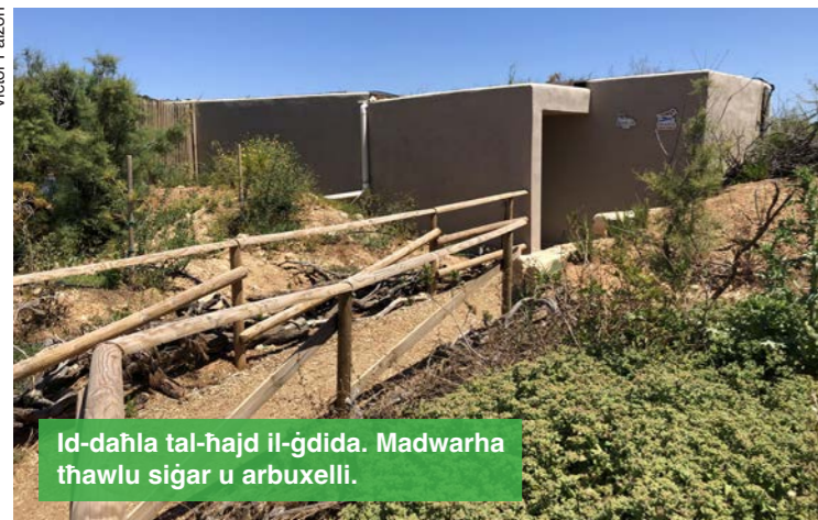
Id-daħla tal-ħajd il-ġdida. Madwarha tħawlu sigar u arbuxelli.