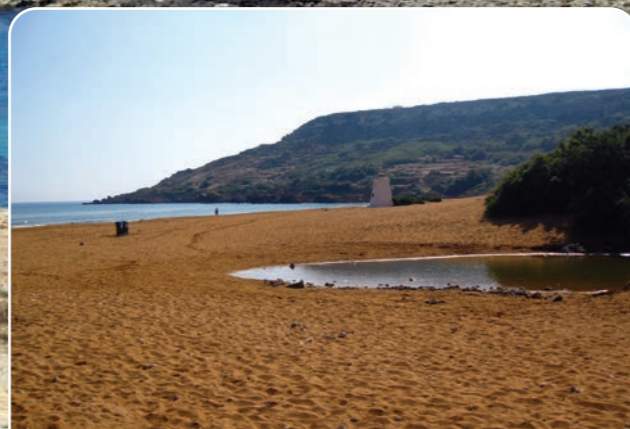
Il-Bajja tar-Ramla l-Hamra

When you visit Natura 2000 sites, keep these 4 things in mind: