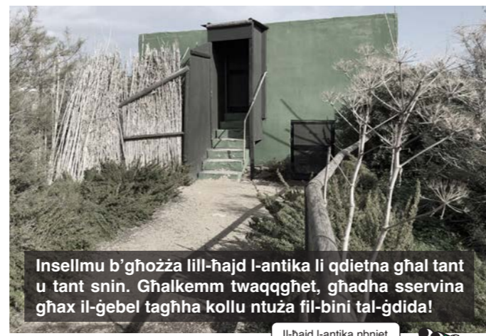
Insellmu b'għozza lill-ħajd l-antika li qdietna għal tant u tant snin. Għalkemm twaqqgħet, għadha sservina għax il-ġebel tagħha kollu ntuża fil-bini tal-ġdida!