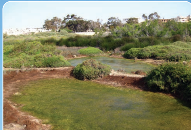
Il-Ballut ta' Marsaxlokk

Exploring Natura 2000 sites around Malta and Gozo is a beautiful experience, however as we have learned it is important to enjoy them responsibly. This is essential to ensure that the rare plants and animals, some of them endemic, are kept safe.