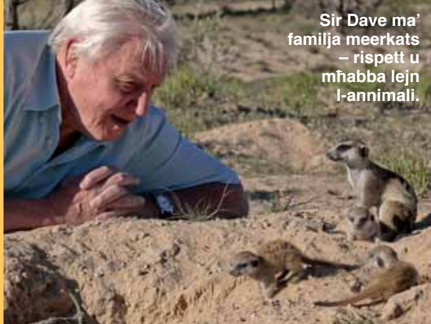
Sir Dave ma' familja meerkats – rispettu u mħabba lejn l-animali.

It-tieni preżentatur ma qagħadx jitbellah u jitmiegħek biex jaqbad l-animali, imma impressjonani iktar. U naf x'jismu, għax huwa l-iktar naturalista famuż u rispettat fid-dinja. Min hu?