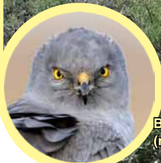
Bagħdan griz (raġel)

Jekk issibu tajr ferut jew għajjen ċemplu lil BirdLife fuq 79255697