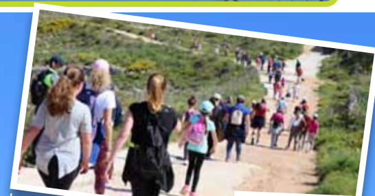
Imxejna fil-Park tal-Majjistral...

Grazzi lil kull min ħa sehem u lil leaders li organizzaw din il-mixja.