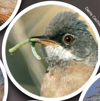
xagħat ta' farfett jew baħrija