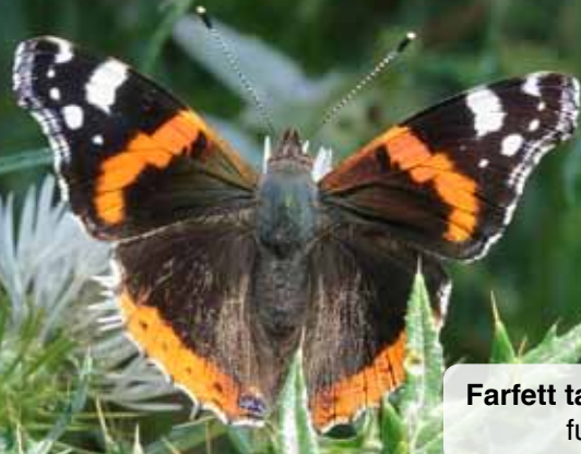
Farfett tal-ħurrieq (red admiral) fuq fjura tax-xewk abjad.