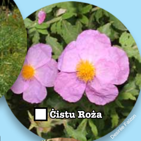
■ Ċistu Roża