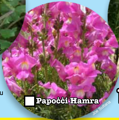
■ Papoċċi Hamra