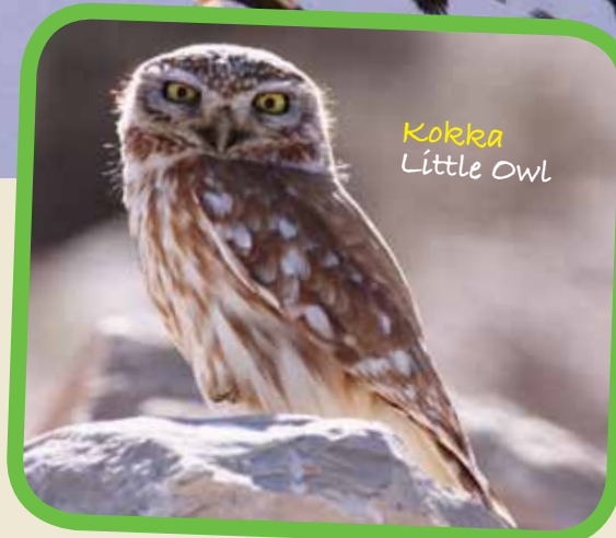
Kokka Little Owl

Il-ġurnata spiċċat fil-post fejn bdejna, fejn dahħalna l-lista.