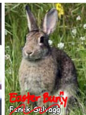
Easter Bunny Fenek Solvaġġ