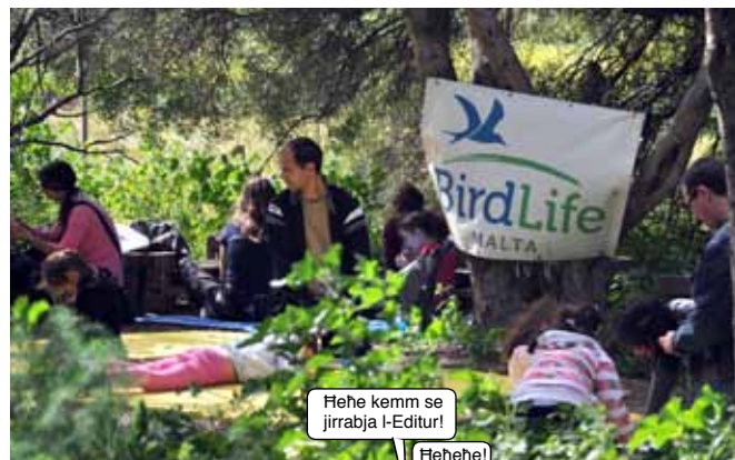
Hehe kemm se jirrabja l-Editur!