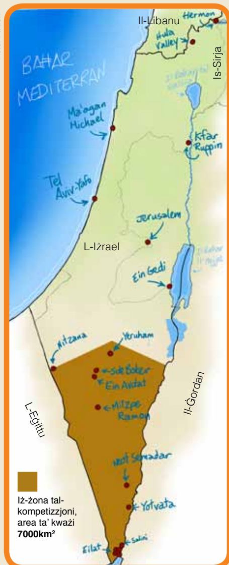
lż-zona tal-kompetizzjoni, area ta' kwazi 7000km²