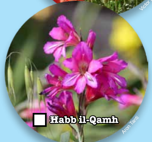
■ Ħabb il-Qamh