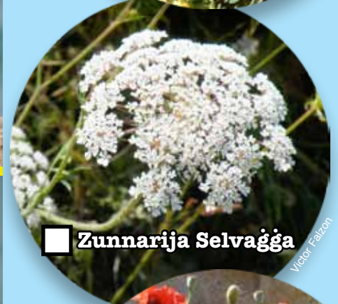
■ Zunnarija Selvagga