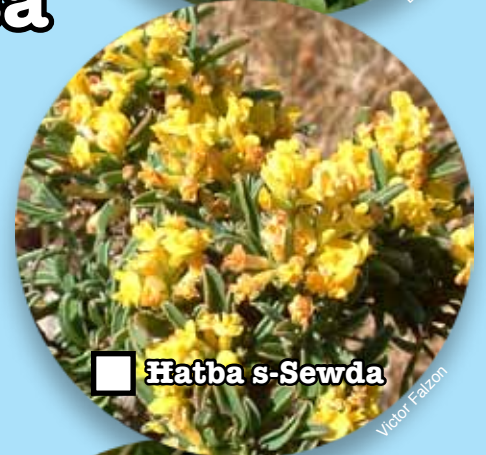
■ Ħatba s-Sewda