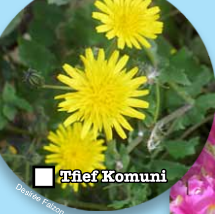
■ Tfief Komuni