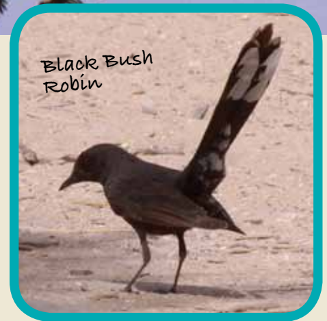
Black Bush Robin

Fiha nnifisha l-kompetizzjoni hija sempliċi: kull tim għandu 24 siegħa biex fihom jara kemm kapaċi josserva jew jisma' speċi ta' għasafar f'żona speċifika. Min jara l-aktar għasafar jirbah.