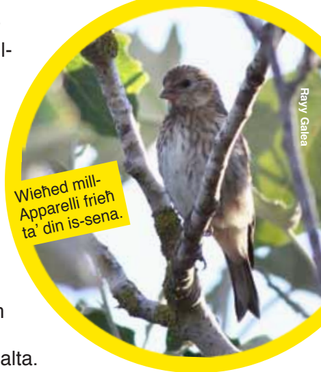
Wieħed mill-Apparelli frieħ ta' din is-sena.

L-Apparell huwa għasfur tal-għana li kull sena jinqabdu eluf minnhom min-nassaba. Barra minn hekk meta par Apparelli jippruvaw ibejtu, spiss jindunaw bihom xi ħallelin, li jtilgħu mas-siġar u jisirqulhom il-bejta bil-bajd jew bil-frieħ. Dan kontra l-liġi għax l-għasafar li jbejtu huma kollha protetti fl-istaġun tal-bejta. Li ma kienx għall-insib u s-serq tal-bejtiet, l-Apparell ibejjet iktar regolari f'pajjiżna. Kif jagħmel f'artijiet u gzejjer oħrajn madwarna.