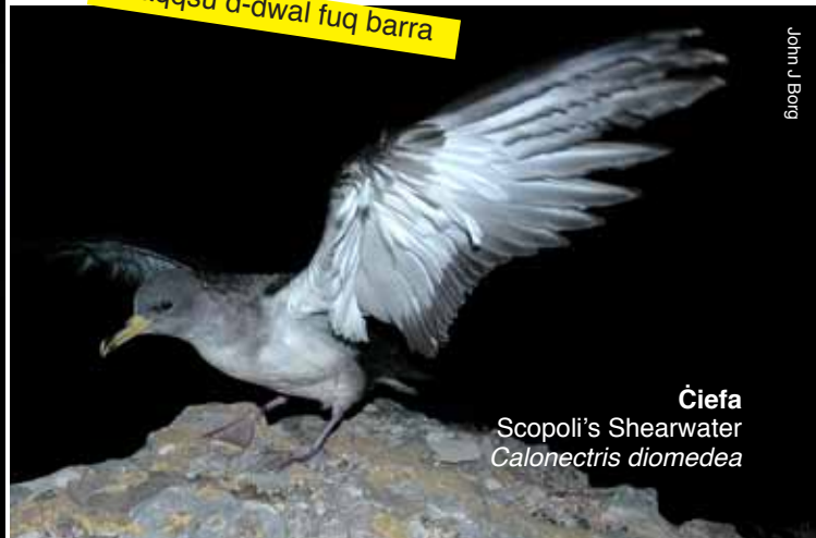
Ċiefa Scopoli's Shearwater Calonectris diomedea

F'dan l-għar fin-naħa ta' fuq ta' Malta jbejjet it-tajr tal-baħar. Minnu jidher dawl qawwi ġej mix-xatt tal-Qawra. Dan id-dawl jixgħel is-sema fl-inħawi u jgħibu qisu binħar, kif jidher fir-ritratti. Dan ifixkel it-tajr tal-baħar, speċjalment frieh li jkunu għadhom kemm hallew il-bejta.