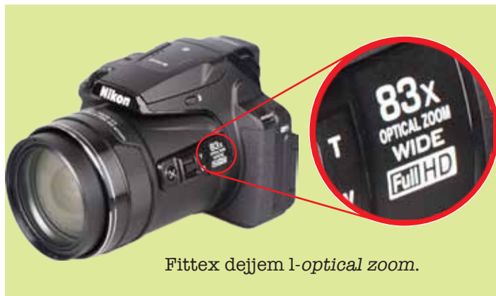
Fittex dejjem l- optical zoom .

Illum issib compact cameras li jkabbrulek 20, 30, 40, anke 60 darba u iktar. Dan tkun tafu minn numru 20x , 40x , eċċ. li jkun miktub fuq il-kamera, spiss mal-ġenb tal-lenti. Qis li jkun hemm mitkub optical zoom mhux digital zoom . Id- digital zoom tal-kamera tużax għax dan jagħtik kwalità ferm baxxa. Għalhekk tixtri kamera fejn jiftaħru bid- digital zoom . Fittex dejjem l- optical zoom .