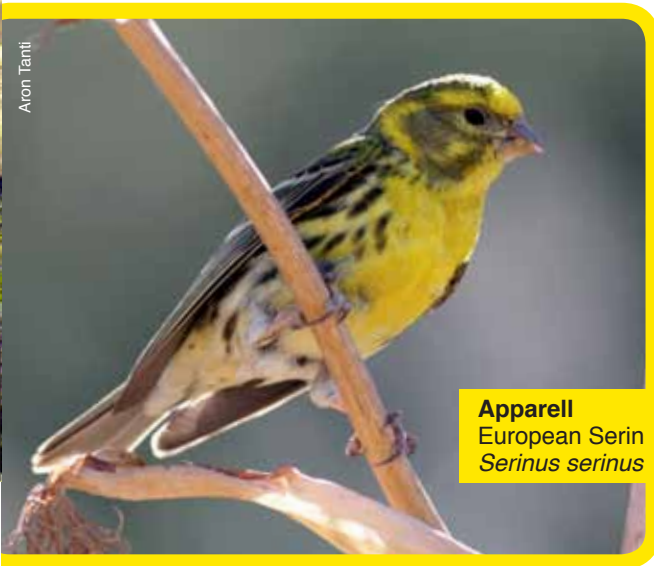
Apparell European Serin Serinus serinus

L-Apparell huwa għasfur żgħir safrani u storbjuż. F'Malta jidher fil-pases tar-rebbiegħa u tal-ħarifa, u ġieli xi par ibejjet f'siġar għoljin fil-Buskett. L-aħħar li nafu biċ-ċert li Apparell bejjet b'suċċess kien fl-2002.